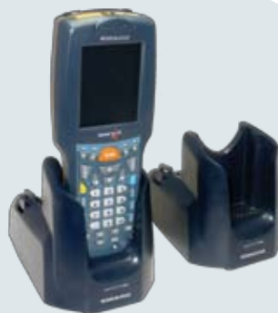
Einfach- und Mehrfach Übertragungsstation